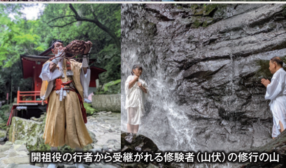
開祖役の行者から受継がれる修験者(山伏)の修行の山