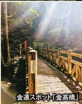
金運スポット「金高橋」

犬鳴山七宝瀧寺は、寺社の中でも大変珍しい原生林の森の参(山)道を登る秋境の寺です。そこは神々が住まわれパワーを感じることができる山で、古来よりその山の不便さにより守られた聖域です。日常の喧騒と便利さから離れ自然と神仏のエネルギーを感じてください。