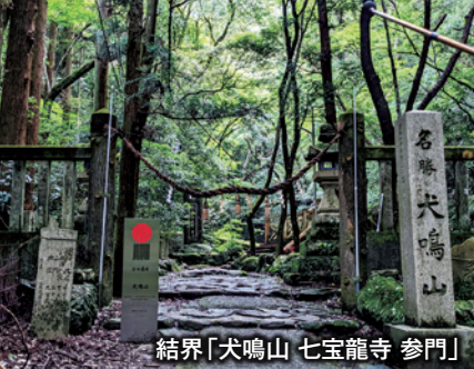
結界「犬鳴山 七宝瀧寺 参門」