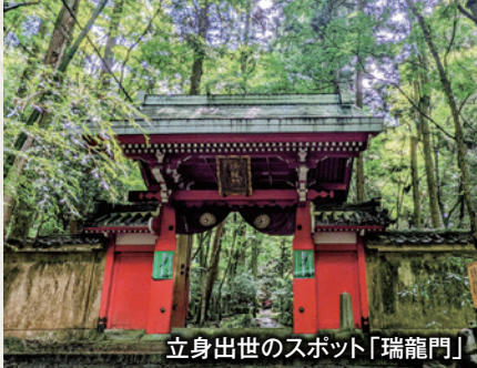
立身出世のスポット「瑞龍門」